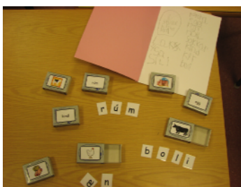
Sýnishorn af tæknivinnu frá Ernunum í Hveragerði

Einnig má hugsa sér nokkurs konar vísbendingaleik áður en sjálfstæð vinna með orðin hefst. Nemendur eru með bingóspjöld fyrir framan sig. Kennari kemur með vísbendingar um orð og nemendur finna út við hvaða orð er átt. K: Hvað var það sem Jói fékk þegar hann seldi kúna? Það byrjar á k. Nemendur svara, kind. K: leggið yfir það orð á spjöldunum. Síðan spila nemendur sjálfstætt.